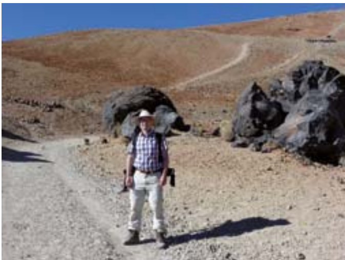
Die bekannten Teide-Eier aus Basalt säumen den Aufstieg zum Pico del Teide.

Um 9 Uhr starten wir auf 2350 m bei strahlendem Wetter die Besteigung des Gipfels. Die ersten Kilometer fühlen sich zunächst als Spaziergang an. Bei moderater Steigung kommen wir gut voran. Wir haben eine herrliche Aussicht und die anfängliche Anspannung ist einer gewissen Erleichterung gewichen.