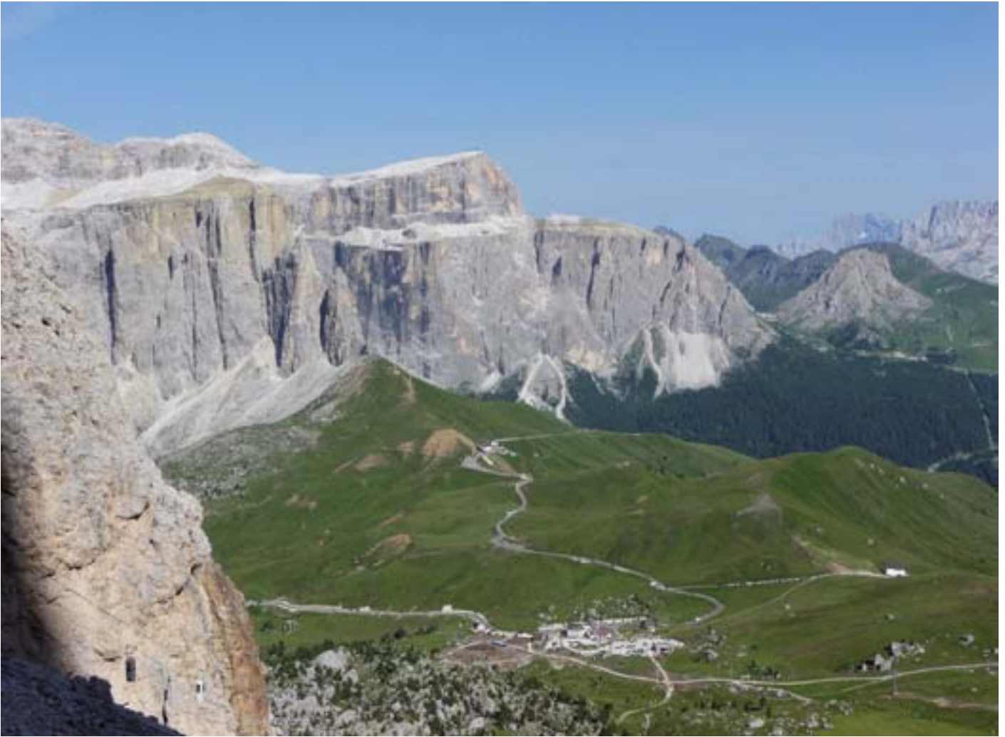
Beim Abstieg von der Langkofelscharte hat man einen herrlichen Blick auf die imposante Sella-Gruppe.

Diesmal sind wir nur zu zweit auf Tour, wenn man mal von den doch sehr zahlreichen anderen Touristen absieht, die sich zu dieser Jahreszeit Südtirol als Wanderziel ausgesucht haben. Für heute ist die Umrundung des Langkofels geplant, Aufstieg zur Langkofelhütte (2253 m) und zur Langkofelscharte (2681 m) und dann der Abstieg zum Parkplatz am Ausgangspunkt beim Sellajochhaus.