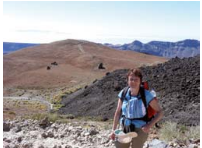
Bald schon wird aus dem gemütlichen Spaziergang ein steiler Anstieg.

Nach ca. 2 Stunden geht es dann richtig zur Sache. Die Steigung wird steiler und wir gewinnen zunächst rasch an Höhe. Ab ca. 3000 m Höhe werden die Intervalle zwischen den Pausen unweigerlich kürzer. Ein Blick auf die Uhr zeigt, dass wir unseren Zeitplan wohl nicht ganz einhalten können. Haben wir uns überschätzt?