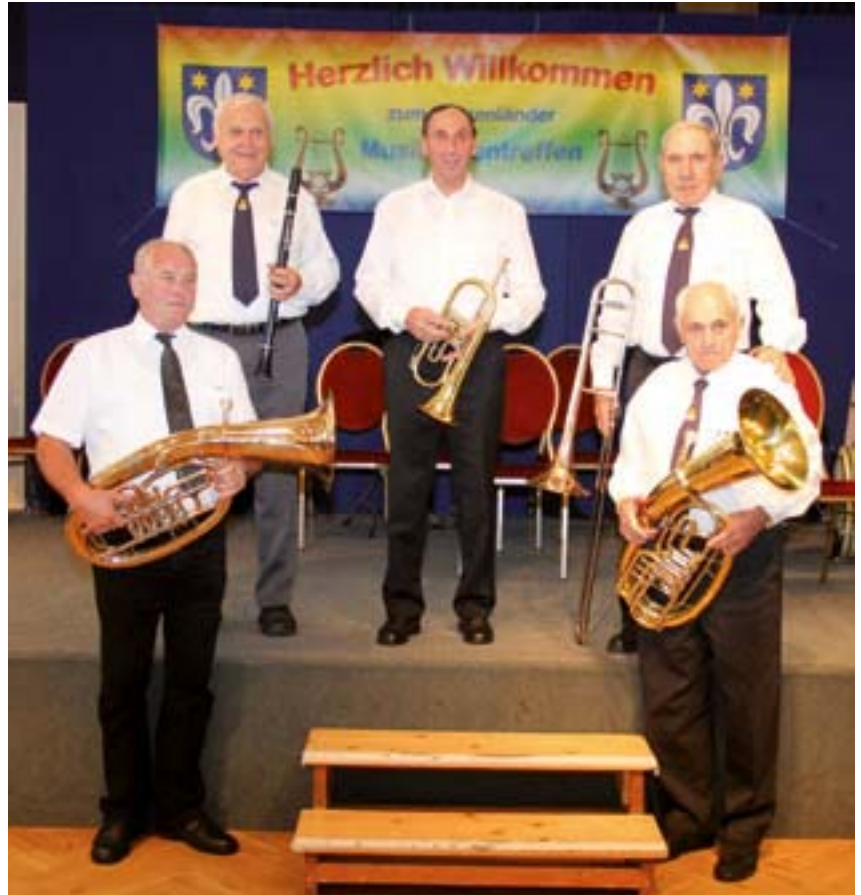
Bei dem gemeinsamen Auftritt der Burzenländer Blasmusik waren die Tartlauer gut vertreten.

den Bläsern wurde im kleinen Kreis noch weiter aufgespielt und gesungen bis spät in die Nacht hinein. Samstagvormittag traten alle Musikanten im weißen Hemd zum gemeinsamen Konzert an. Es war ein beeindruckendes Bild, das sicherlich dem einen oder anderen auch emotional nahe ging. Den letzten Auftritt absolvierten die Musiker am Nachmittag. Den Abend bestritt die Band Silver Stars, die mit einem vielfältigen Repertoire alle auf die Tanzfläche lockte.