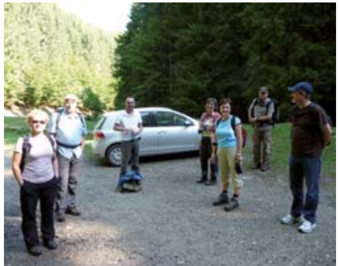
Anlässlich des Sachsentreffens 2011 unternahmen wir eine spätsommerliche Wanderung im Krähenstein (Ciucas).

In späteren Jahren folgten weitere Wandertouren im Freundeskreis wie etwa 1977 durch das Fogarascher Gebirge. Wir wanderten von Hütte zu Hütte, kamen an wunderschönen Gletscherseen (z.B. Bâlea-See) vorbei und bestiegen natürlich auch die Spitzen Negoiu und Moldoveanu.