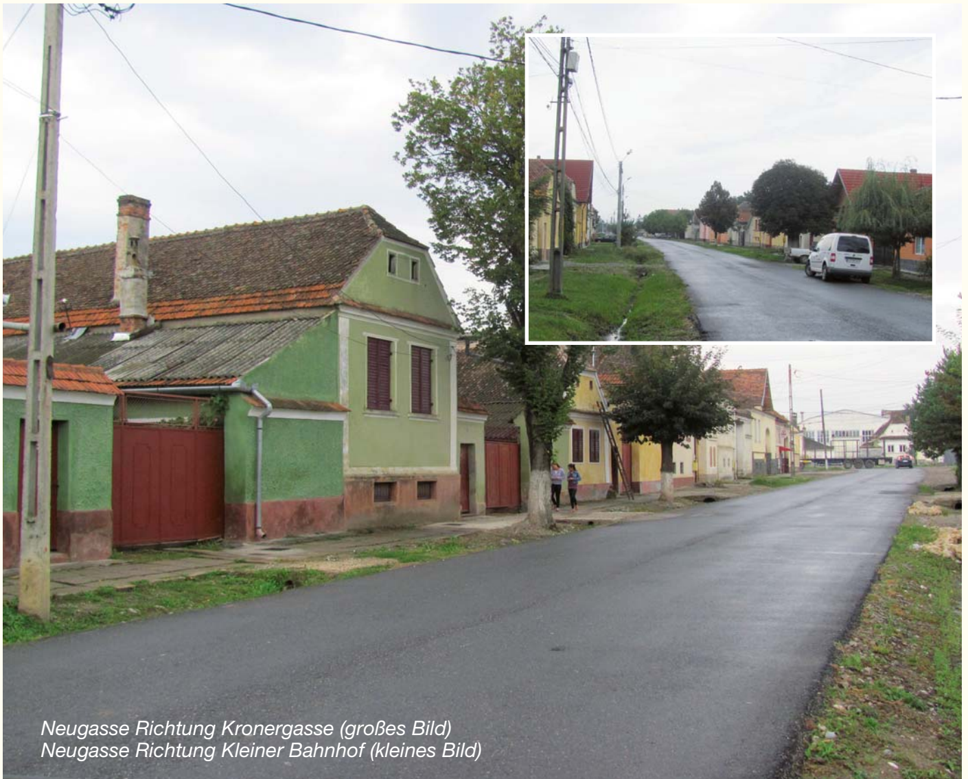
Neugasse Richtung Kronergasse (großes Bild) Neugasse Richtung Kleiner Bahnhof (kleines Bild)

In diesem Jahr haben einige Straßen in Tartlau erstmalig einen Asphaltbelag erhalten. Neugasse und Gässchen, Äschergasse, Kröteneck und Stefan-Ludwig-Roth-Gasse gehören dazu, einige weitere sind in Vorbereitung und werden noch folgen. Der erste Anblick ist ungewöhnlich, doch schnell hat man sich an das neue Bild gewöhnt. Über die Qualität der durchgeführten Arbeiten denkt man besser nicht nach, sonst ist die Freude schnell wieder vorbei.