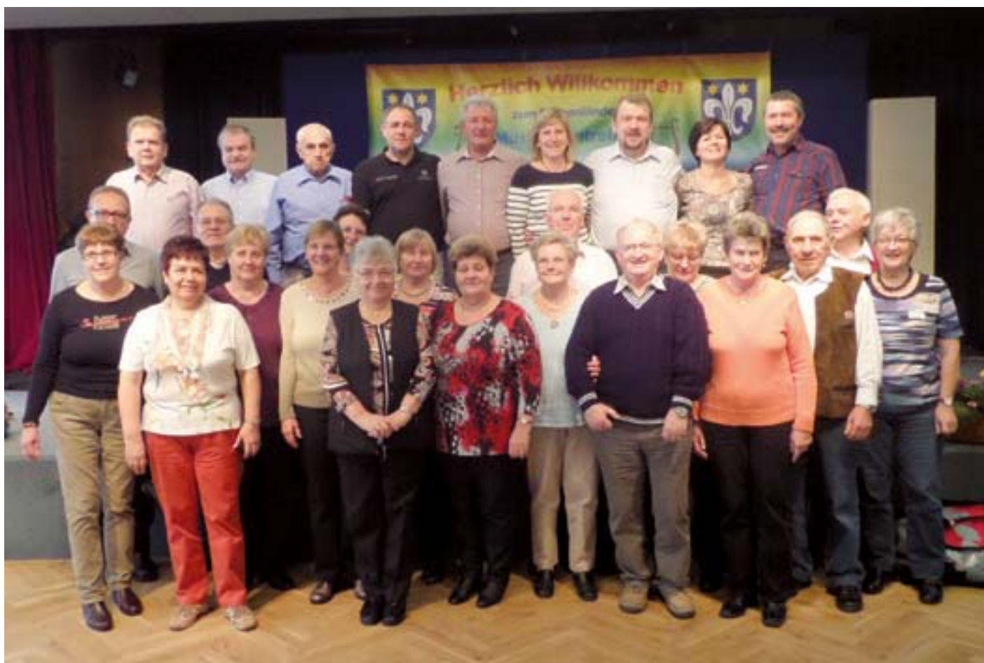
Zahlreiche Tartlauer sind der Einladung zum Musikantentreffen gefolgt.

Der Ablauf ist eigentlich schnell erzählt, denn es gab Blasmusik, Blasmusik und wieder Blasmusik. Und wer unsere Sachsen kennt, weiß, dass – sobald die Musik erklingt – sich auch schnell die Tanzfläche füllt. Dennoch sollten ein paar Details nicht unerwähnt bleiben. An Allerheiligen (Freitagnachmittag) eröffnete Klaus Oyntzen bei Kaffee und Kuchen die Veranstaltung. Zwei Riesenkühlschränke waren randvoll mit Kuchen gefüllt – auf die sächsische Frau ist eben Verlass (ich entschuldige mich bei den emanzipierten Männern, die eventuell ebenfalls gebacken haben, üblich war es zumindest früher nicht). Der Weidenbacher HOG-Vorsitzende, der auch als einer der Väter dieses Treffens gilt, zog eine positive Bilanz der ersten beiden Veranstaltungen und freute sich darüber, dass zum einen die Teilnehmerzahl des vorigen Treffens wieder erreicht werden konnte und dass das ehrgeizige Ziel, eine Dokumentation des Burzenländer Blasmusiklebens zu erstellen, auf der Zielgeraden ist und wahrscheinlich