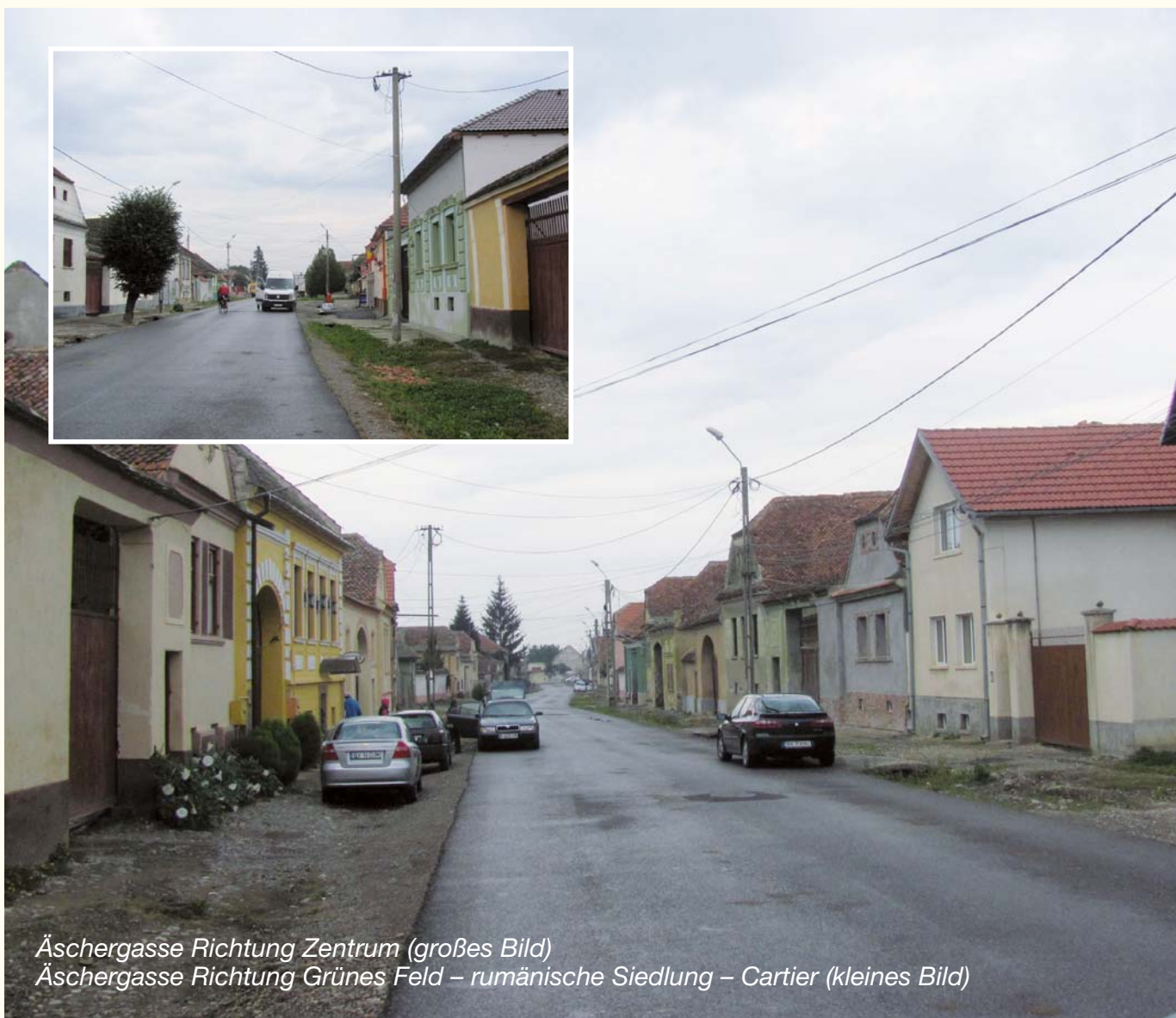
Äschergasse Richtung Zentrum (großes Bild)