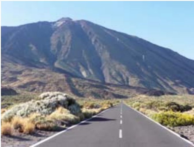
Hier ein Blick vom Teide-Plateau auf den majestätischen Gipfel Pico del Teide (3718 m).

Leider sind inzwischen einige Wolken aufgezogen, so dass die Fernsicht (z.B. auf die anderen kanarischen Inseln) leider nicht gegeben ist. Es ist trotzdem ein überwältigendes Erlebnis, auf dem höchsten Berg Spaniens zu stehen!