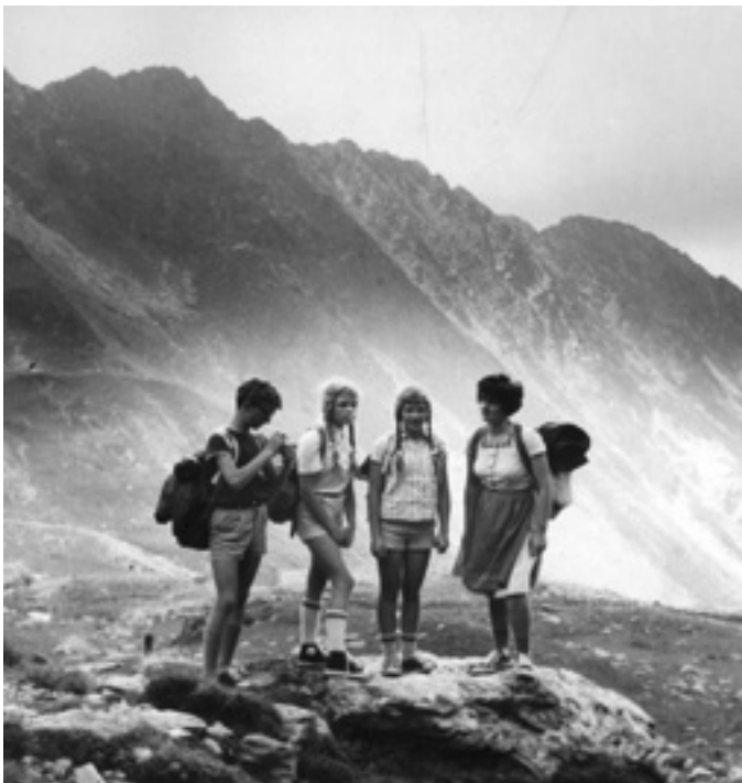
1972 wanderten wir im Fogarascher Gebirge von Hütte zu Hütte.