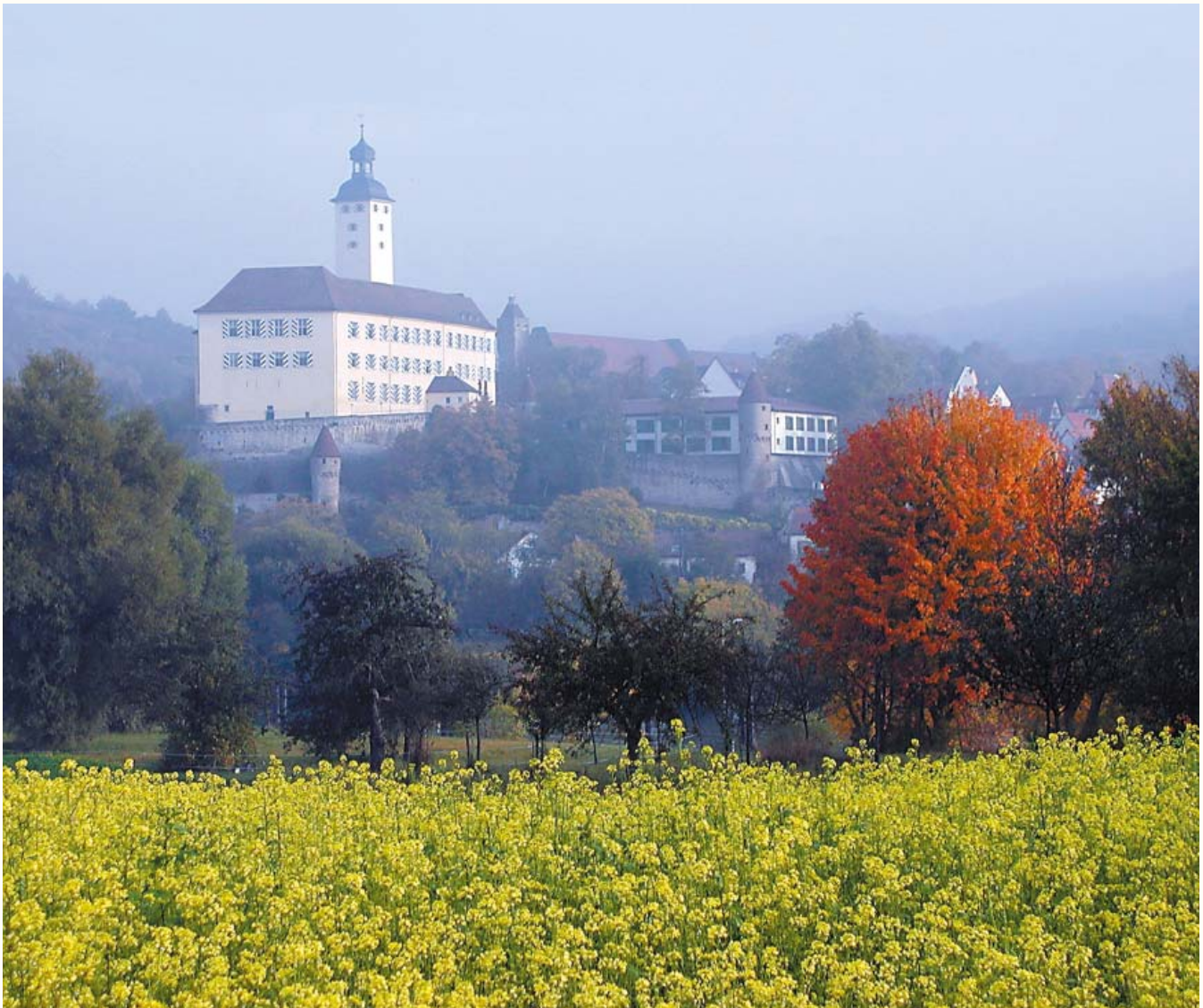
Schloss Horneck im herbstlichen Nebel.

Das Siebenbürgische Museum ist das zentrale Museum dieser Gruppe außerhalb Rumäniens. Auf ca. 600 qm. werden hier die Exponate nach thematischen Schwerpunkten ausgestellt.