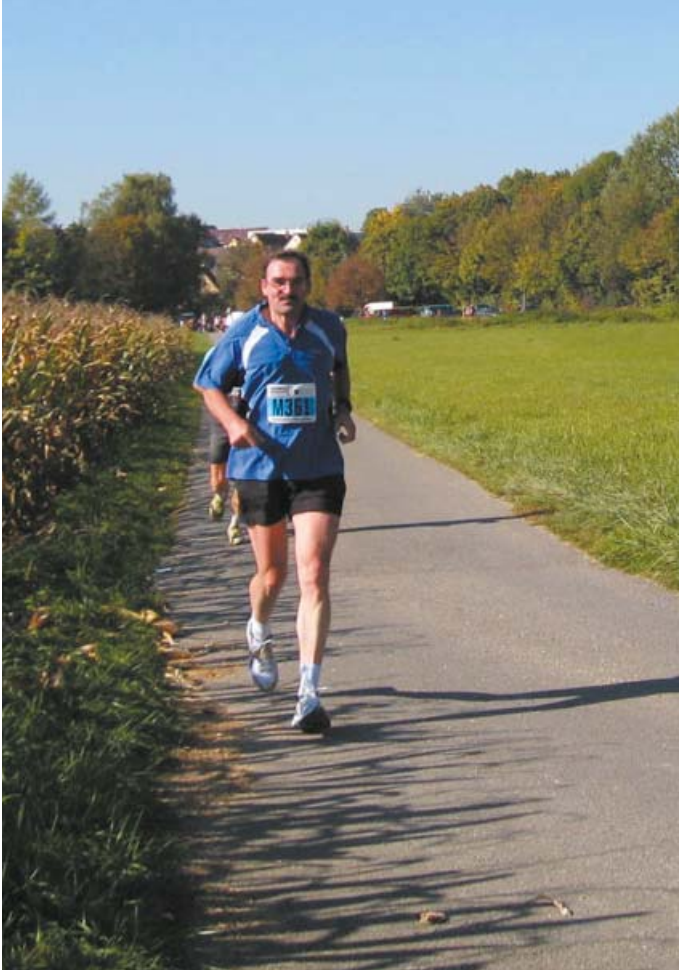
Bottwartal-Marathon 2007, km 35.

Der Marathonwettkampf selber ist für einen ambitionierten Läufer, der seine persönliche Bestzeit immer vor Augen hat und eine gute Platzierung erreichen will kein Genusslauf mehr. Bei einer guten Vorbereitung ohne Erkrankung oder Verletzung fängt der eigentliche Marathon nach ca. 30 km an. Wenn einen der „Mann mit dem Hammer“ auch nur leicht erwischt, muss man sich bis ins Ziel quälen.