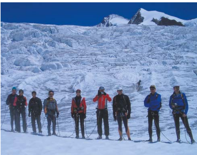
Großer Aletschgletscher am Concordiaplatz, 2007

Amüsante Begegnungen gab es auch mit voll ausgerüsteten Bergsteigern. Nachdem z.B. der größte Teil unserer Gruppe ein langes Schneefeld mit den Laufschuhen im alpinen Stil abfahren und eine Gruppe Bergsteiger dies recht kritisch beäugt hatte, mokierten diese sich über den Leichtsinn und die unzureichende Ausrüstung für hochalpine Aktivitäten. Darauf wurde den Bergsteigern erklärt, welche Tagesstrecke in diesem Aufzug schon zurückgelegt wurde, worauf diese dann ziemlich kleinlaut weiterzogen.