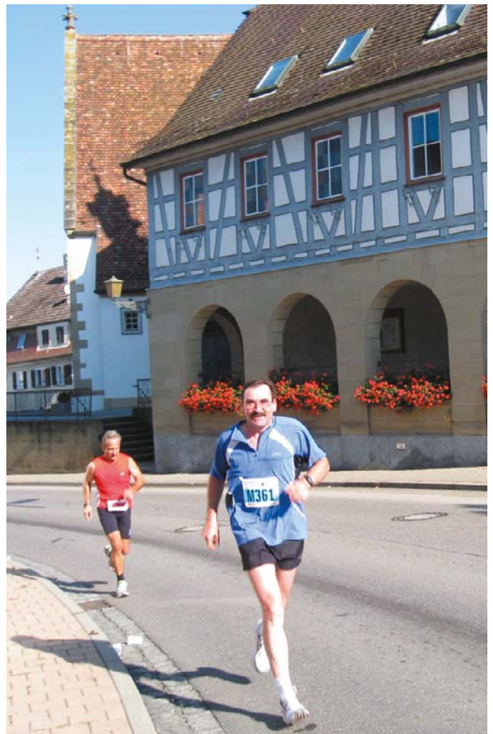
Bottwartal-Marathon 2007, km 25

In Läuferkreisen ist vor allem der Wunsch sich auf der Marathonstrecke (42.195 km) zu versuchen oder sogar einen Ultramarathon zu laufen das Hauptthema. So dauerte es nicht mehr lange, bis ich dieses Ziel auch in Angriff nahm und mich darauf vorbereitete. Mindestens 12 Wochen intensives Marathontraining sind notwendig, um sich optimal vorzubereiten. Diese Vorbereitungszeit ist im Rückblick auf die bisher über 20 Marathon- und Ultraläufe immer das Schönste gewesen. Vor allem die langen Trainingseinheiten von 25-35 km sind eine körperliche und mentale Herausforderung und waren immer genüssliche, schöne Naturläufe.