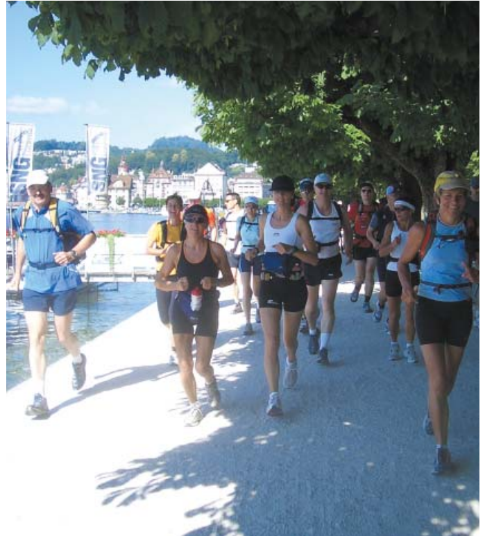
Start zum Alpenberglauf in Luzern, 2007

Im letzten Jahr war ich zum fünften Mal bei einer, von einem Schweizer Laufveranstalter organisierten, 6 bis 7 Tage dauernden Alpen-Tour. Täglich werden zwischen 30 und 45 km gelaufen und dabei 1500-2200 Höhenmeter bergauf und bergab überwunden. Das Gepäck wird von Hotel zu Hotel transportiert und gelaufen wird mit kleinem Notrucksack von 5-6 kg über Bergpfade und Gletschertrails.