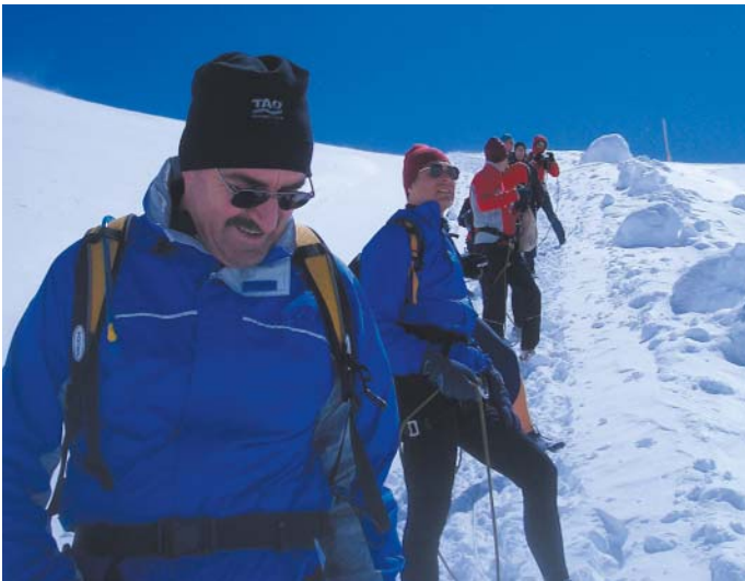
Abstieg vom Jungfrauoch, 2007

Für die Gletscherbegehungen wurden immer Bergführer engagiert und die entsprechende Ausrüstung mit Sicherheitsgurt und Seil verwendet. Wie unerlässlich diese Ausrüstung war, zeigte sich jedes Mal wenn eine Läuferin oder Läufer beim Sturz in die Spalte noch aufgefangen werden konnte, so dass wir abends im Hotel solche Erlebnisse lustig fanden und bis ins letzte Detail mit Humor durchleuchten konnten.