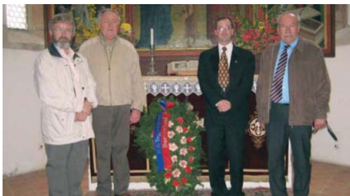
Kranzniederlegung vor dem Altar in Tartlau

Anschließend hat man sich im Rathaushof bei Kaffee und Kuchen mit den anwesenden Tartlauern unterhalten. Nach dieser kleinen Stärkung sind wir zum Friedhof gefahren, wo wir mit der ganzen Delegation eine Besichtigung machten. Trein erläuterte kurz den Stand der Dinge, vor allem aber die Heldengräber auf dem Friedhof. Die Weiterfahrt führte uns dann über die Mühlgasse am Pfarrhaus vorbei die Langgasse hinunter und über die Lunca weiter nach Honigberg.