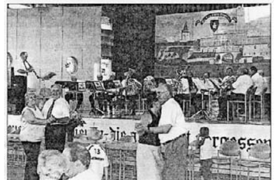
Die Tartlauer Blaskapelle spielte in der Festhalle in Ingersheim zum Tanz auf. In Tartlau lebten 1998 noch 176 Deutsche.