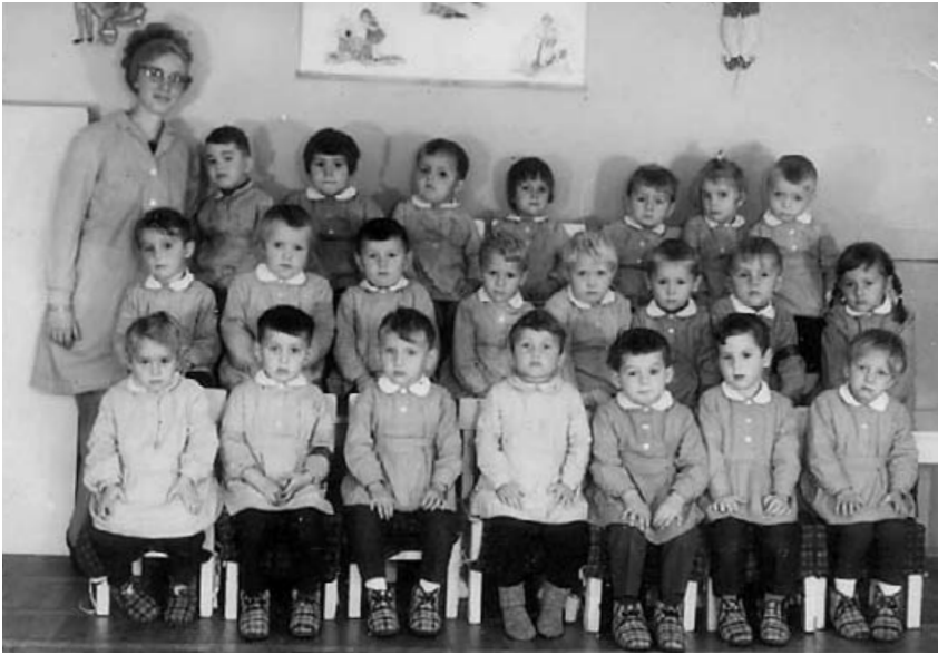
Photo aus dem Kinderkaten Gr. 1 1970/1971