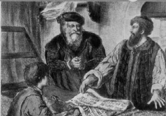
In Deutschland erfunden: Gutenbergs Buchdruck (1440)