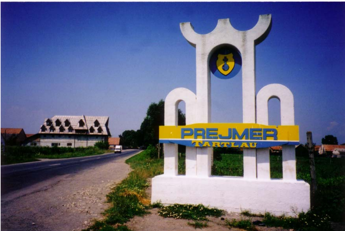
Wie zu erkennen ist, hat Tartlau bei seinen Einfahrten die Doppelbeschriftung.